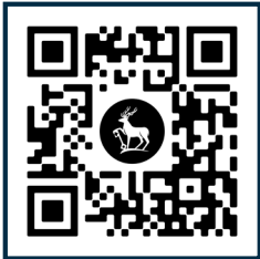
学费及奖学金信息